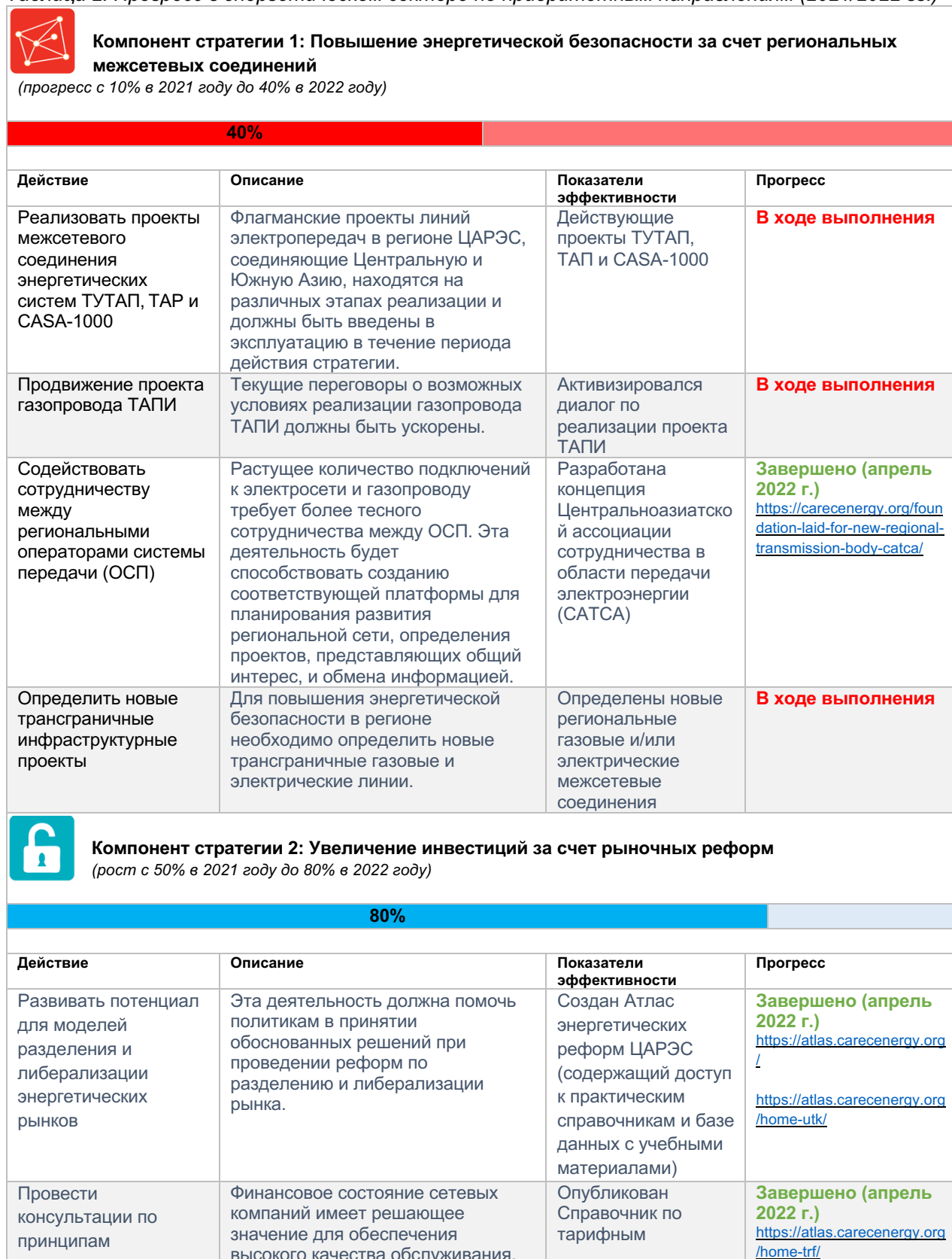
Таблица 2: Прогресс в энергетическом секторе по приоритетным направлениям (2021/2022 гг.)